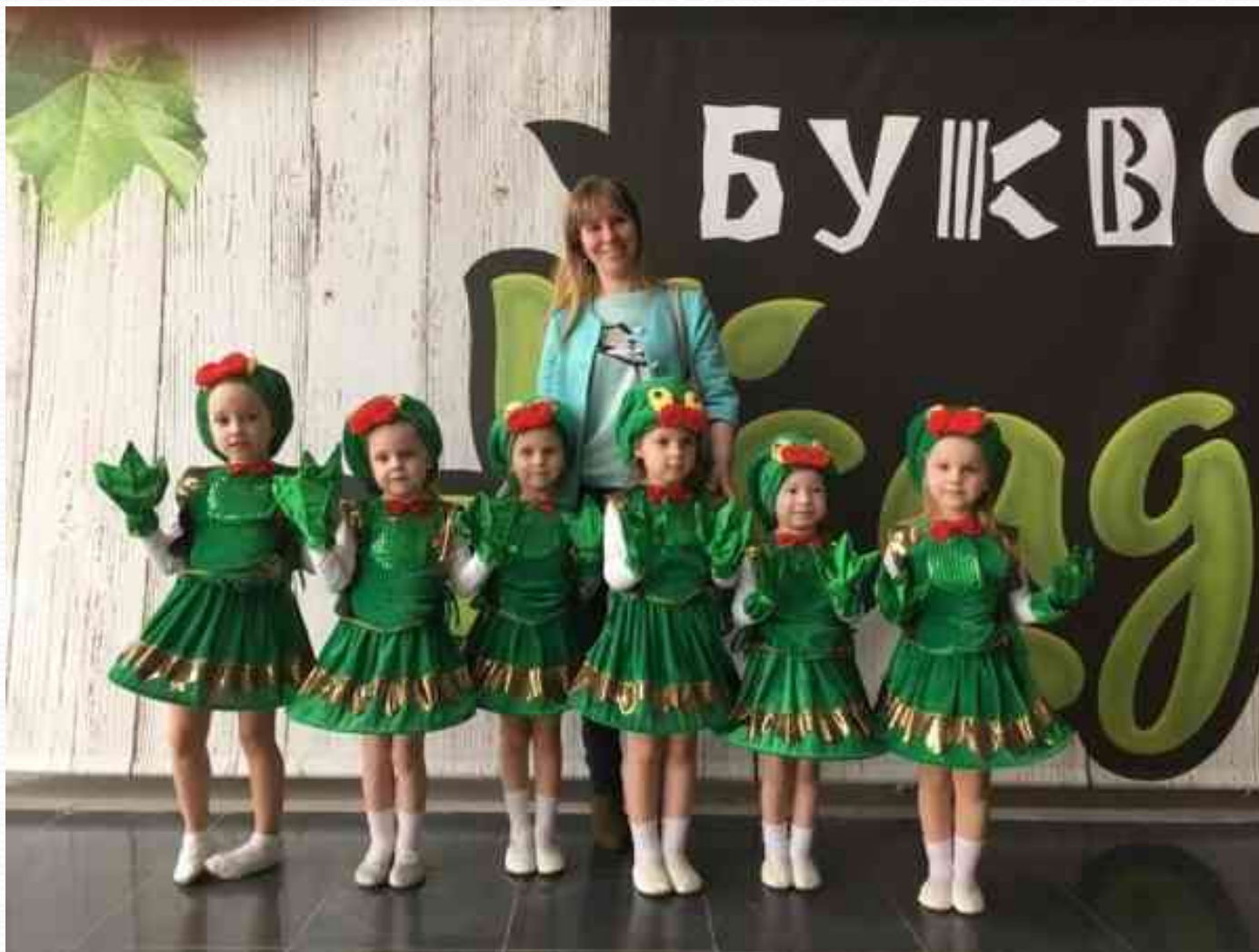
Победа воспитанников на городском проекте «Фестиваль детства» (апрель 2017г.)