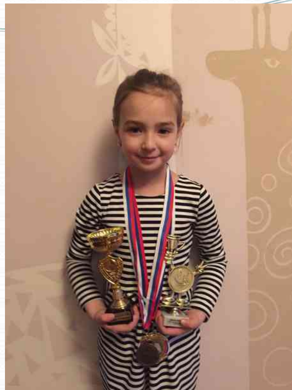
Первое место в районном соревновании «Праздник на воде» среди девочек, Личное первенство (апрель 2017г.)