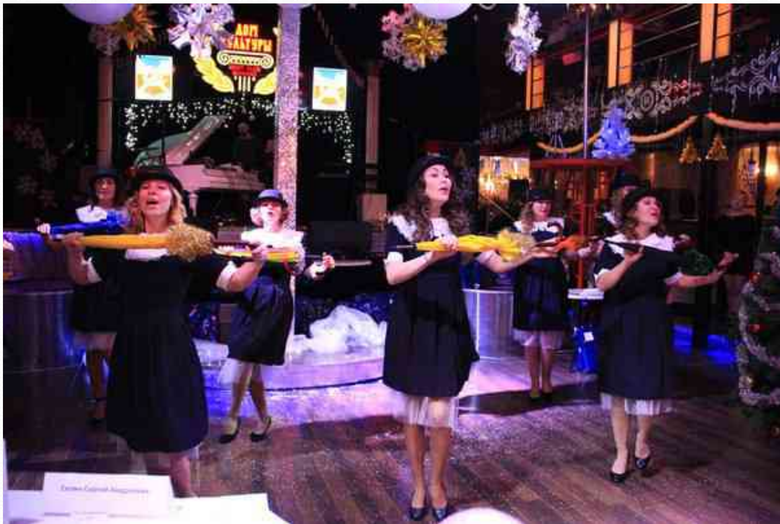
Диплом лауреата I степени в муниципальном конкурсе «Битва хоров» среди коллективов ТБООУ и ТБДОУ (МО «Озеро Долгое», декабрь 2016 г.)