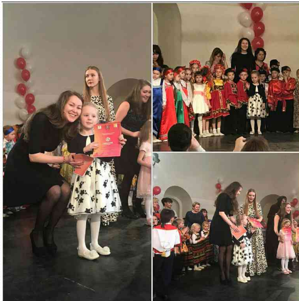
Победитель Городского конкурс народного творчества «Мир без границ» (апрель 2017г.)