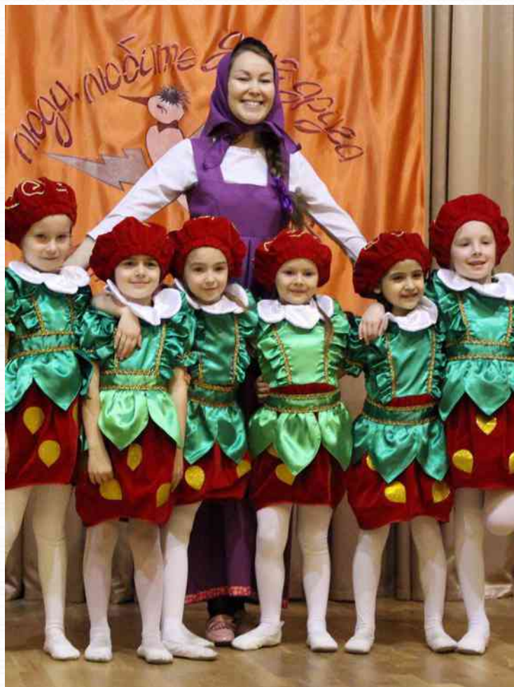
Диплом II степени в районном конкурсе «Журавушка» (март 2017 г.)