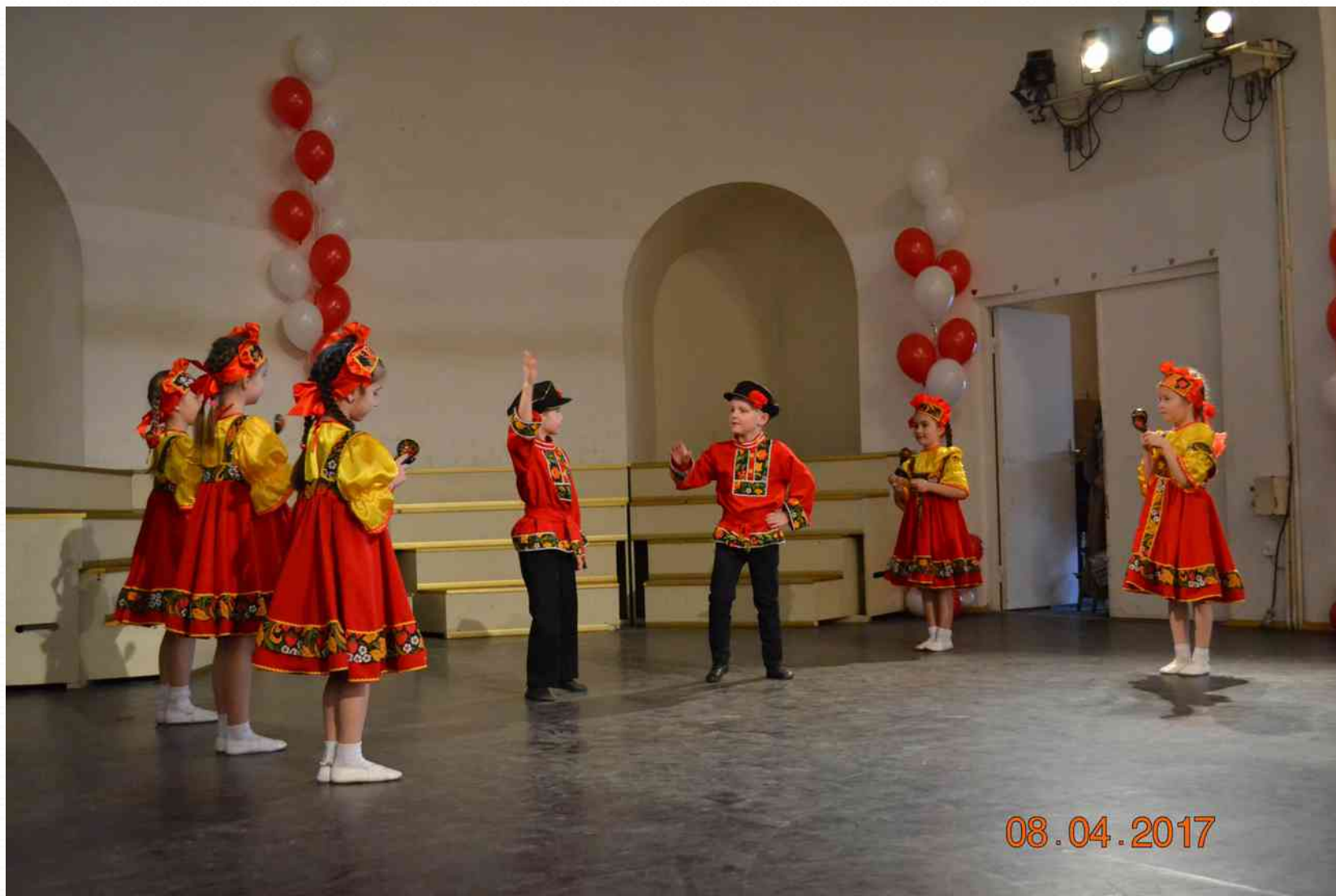
Победитель Городского конкурса народного творчества «Мир без границ» (апрель 2017г.)