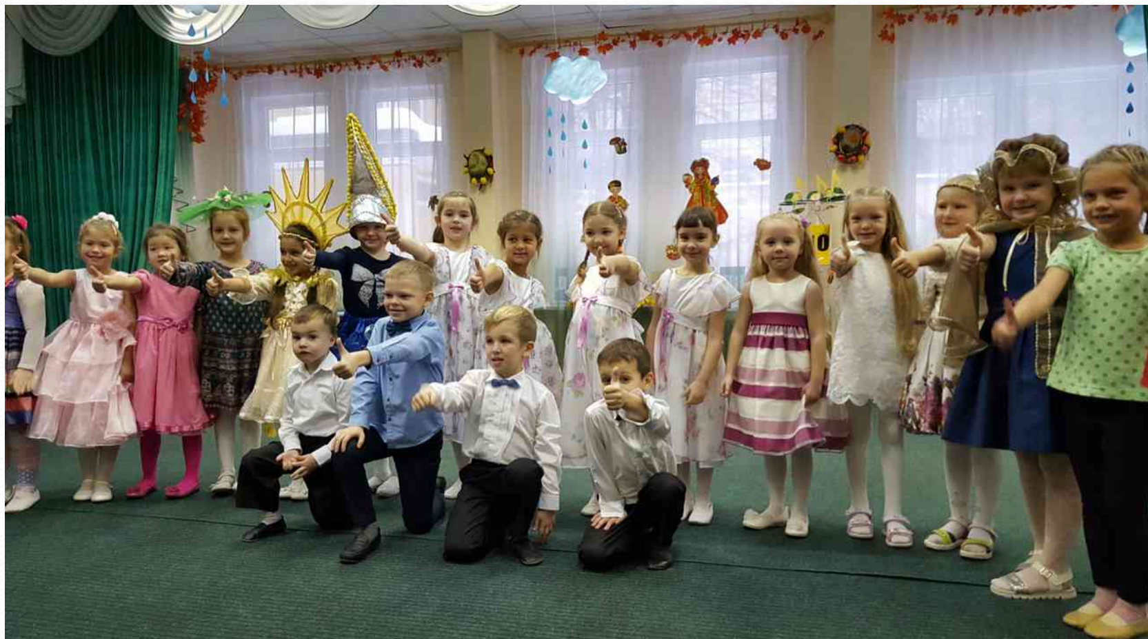
Лауреат II степени фестиваля- конкурса «Веселые нотки» среди воспитанников ГБДОУ МО «Озеро Долгое -1» Приморского района (ноябрь 2016 г.)