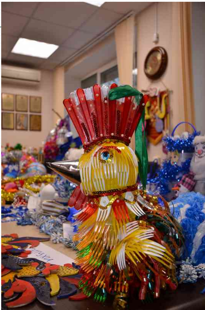
Лауреат II степени Муниципального конкурса новогодней игрушки-2016 «Новогоднее чудо»- в номинации «Лучшая игрушка» (декабрь 2016)