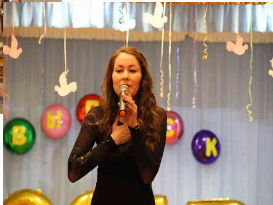
Лауреат III степени районного конкурса «Вершина мастерства» Номинация «Музыкальный руководитель» (февраль 2017 г.)