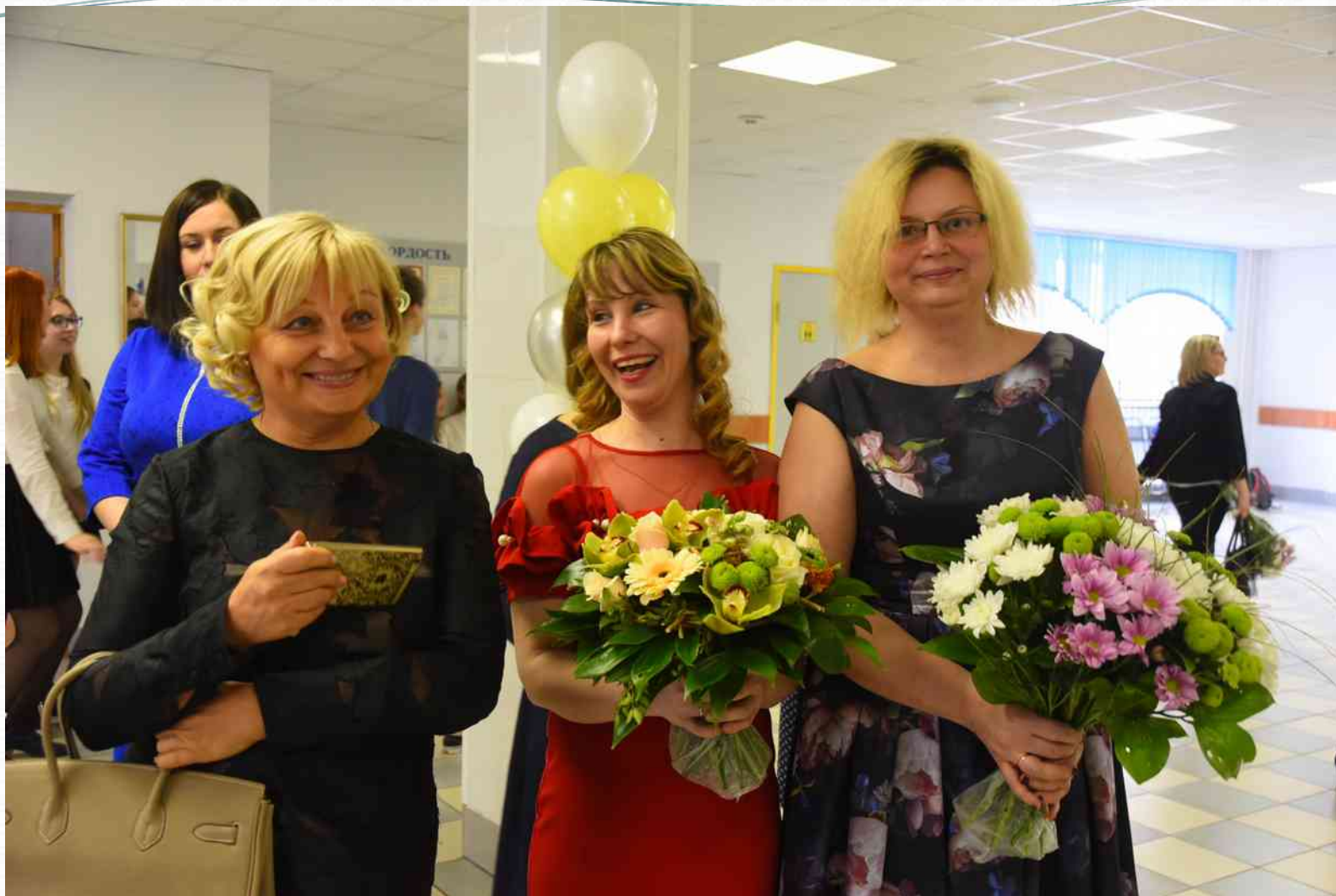
Победитель районного конкурса педагогических достижений 2016-2017 учебного года «Грани педагогического мастерства» Номинация «Лучший проект», подноминация «Педагогический проект» (апрель 2017 г.)