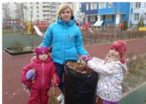
Осенний и весенний субботники