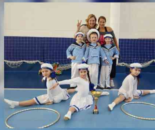
Победитель районного соревнования по спортивному танцу (апрель 2017г.)