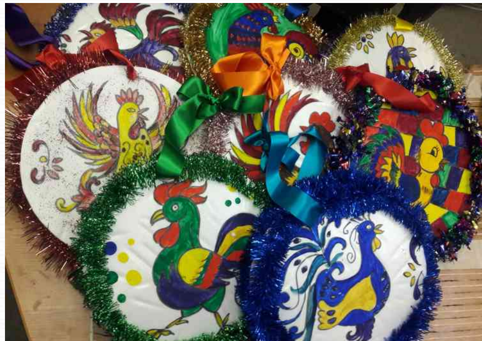
Победитель в номинации «Символ года» творческого конкурса «Елочная игрушка» среди коллективов ТБДОУ методического объединения «Озеро Долгое -1» (декабрь 2016)