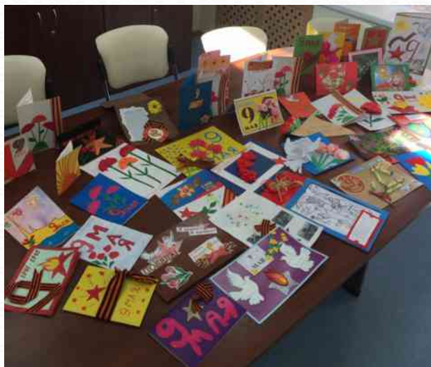
Акция «открытие ветерану» (май 2015 г.)