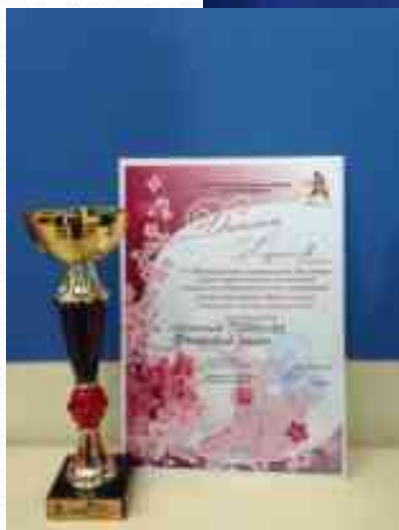
Диплом лауреата 3 степени в межрайонном конкурсе «Живи танцуя» среди коллективов ТБОУ и ТБДОУ (апрель 2017г.)