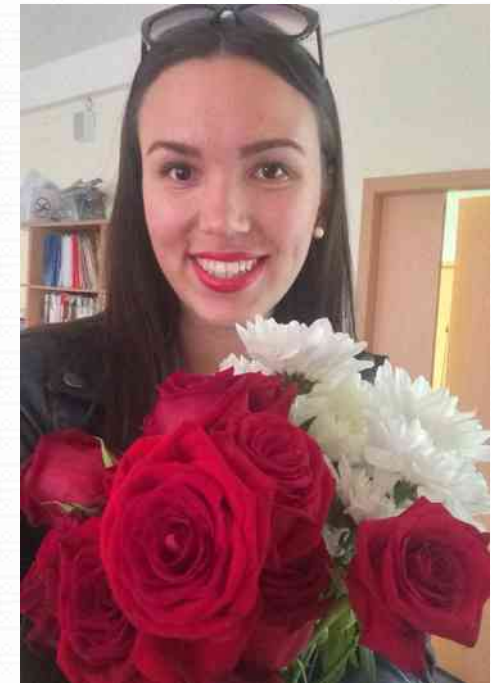
Победитель Всероссийского конкурса стипендий и грантов имени Л.С. Выготского (апрель 2017г.)