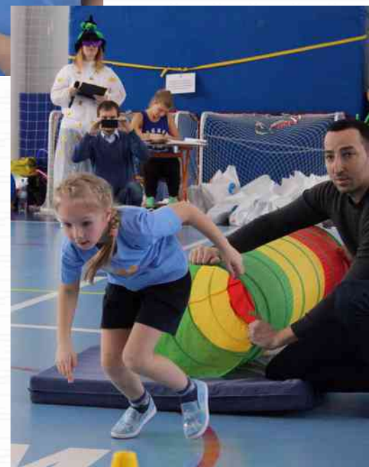
Призер районных соревнований среди ГБДОУ Приморского района «Веселые старты» (март 2017г.)