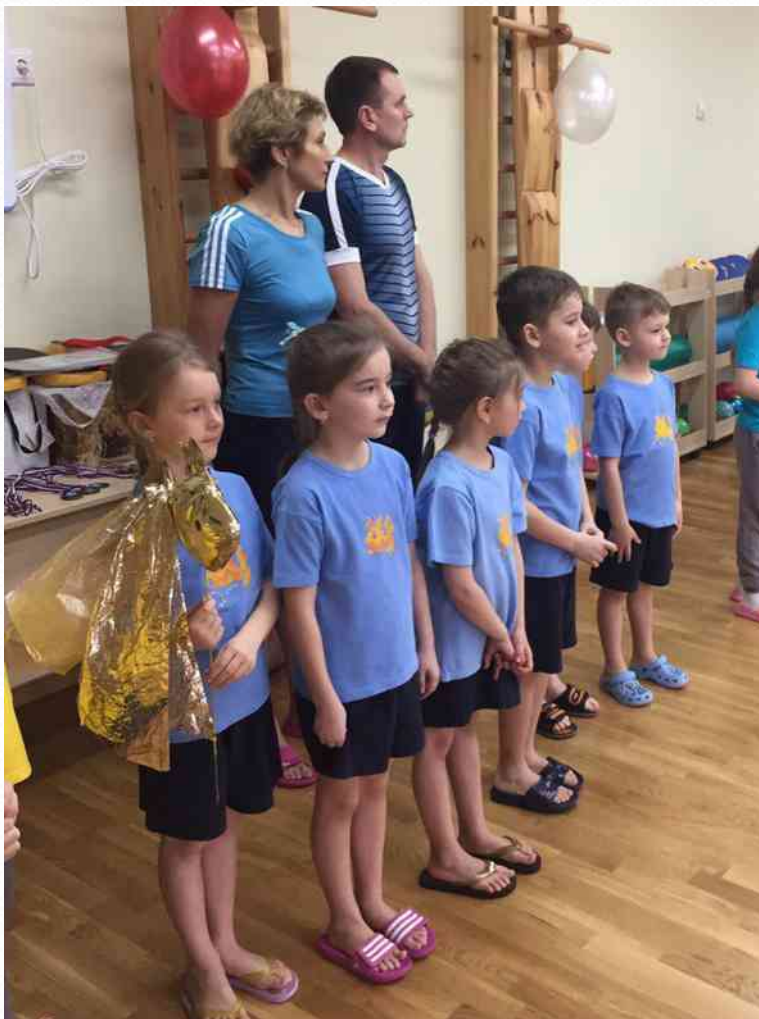
Второе место в районных соревнованиях среди команд подготовительных групп ДОО «Праздник на воде» (апрель 2017г.)