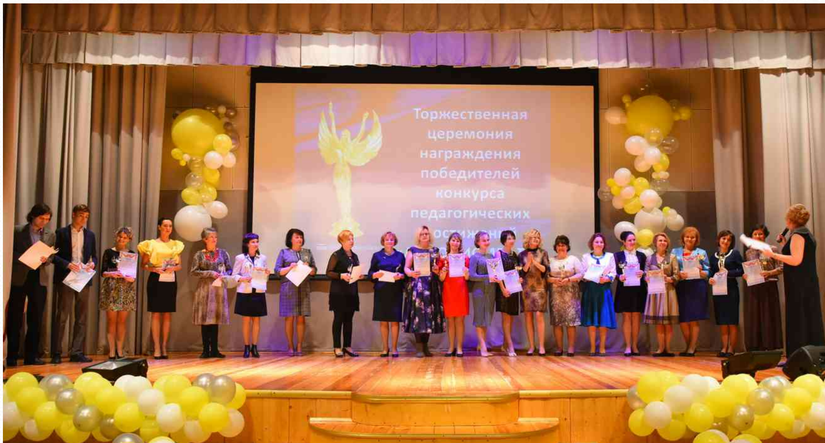
Победитель межрайонного конкурса инновационных продуктов «ЛУЧШИЙ ИННОВАЦИОННЫЙ ПРОДУКТ» Номинация «Образовательная деятельность» (апрель 2017г.)