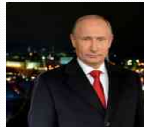
Путин Владимир Владимирович